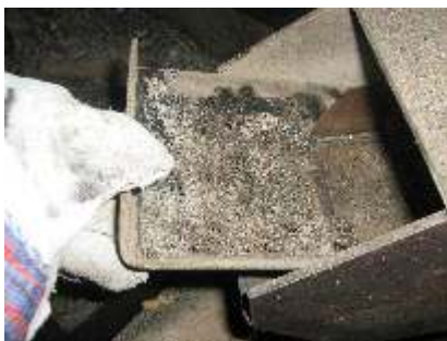
Отстранете скарата на горелката, като внимавате да не разсипете пепел.