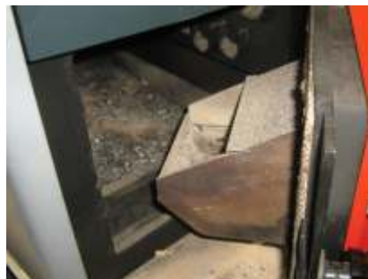
Отворете капака на котела.