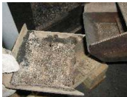
Изхвърлете пепелта от скарата на горелката в пепелника на котела или в друг подходящ съд.