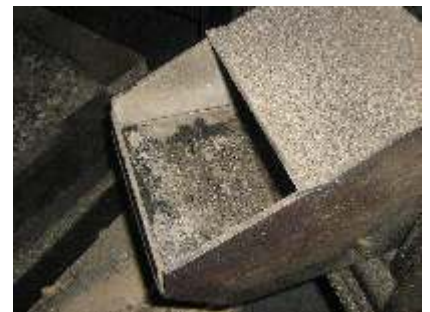
Проверете пепелния остатък върху скарата на горелката.